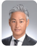
株式会社 フロンティアマネジメント バリュエーション・プラットフォーム部門 企業価値戦略部 Xチーム シニアディレクター