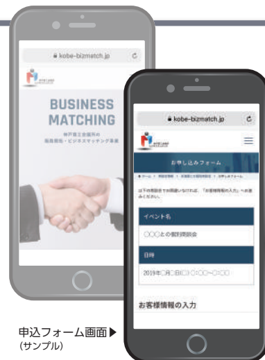
申込フォーム画面 (サンプル)