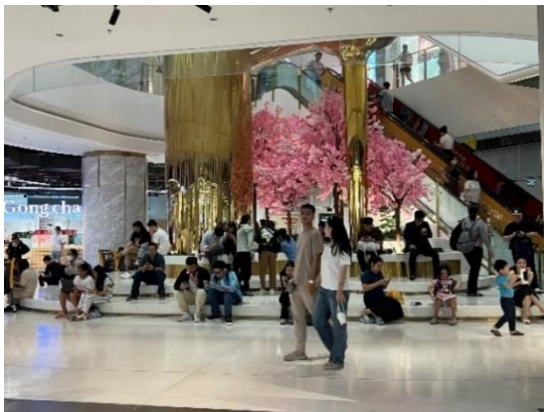
同モールの中で人が集まる階段前スペースで ポップアップ店舗を開設します (9 m 2 )