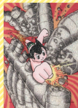
▲ジュエリー・絵画 『鉄腕アトム』(アトム)