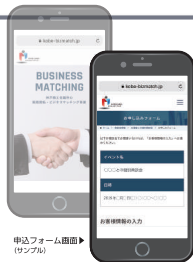
申込フォーム画面 (サンプル)