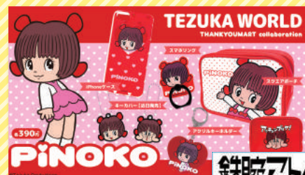
▲雑貨・小物 「ブラック・ジャック」 (ピノコ)