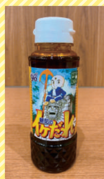
▲食品調味料 「三つ目がとおる」(写楽保介)

手塚プロダクションの所有するキャラクターを活用した食品パッケージや雑貨・小物、靴・サンダル、ジュエリー・絵画など