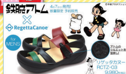
『鉄腕アトム』(アトム) ▼靴・サンダル