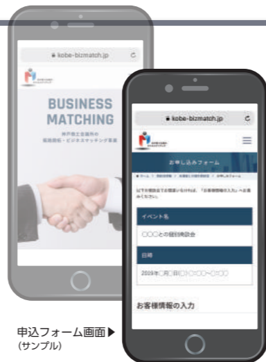
申込フォーム画面 (サンプル)

「JR西日本のライセンス活用商談会」申込フォーム → https://kobe-bizmatch.jp/